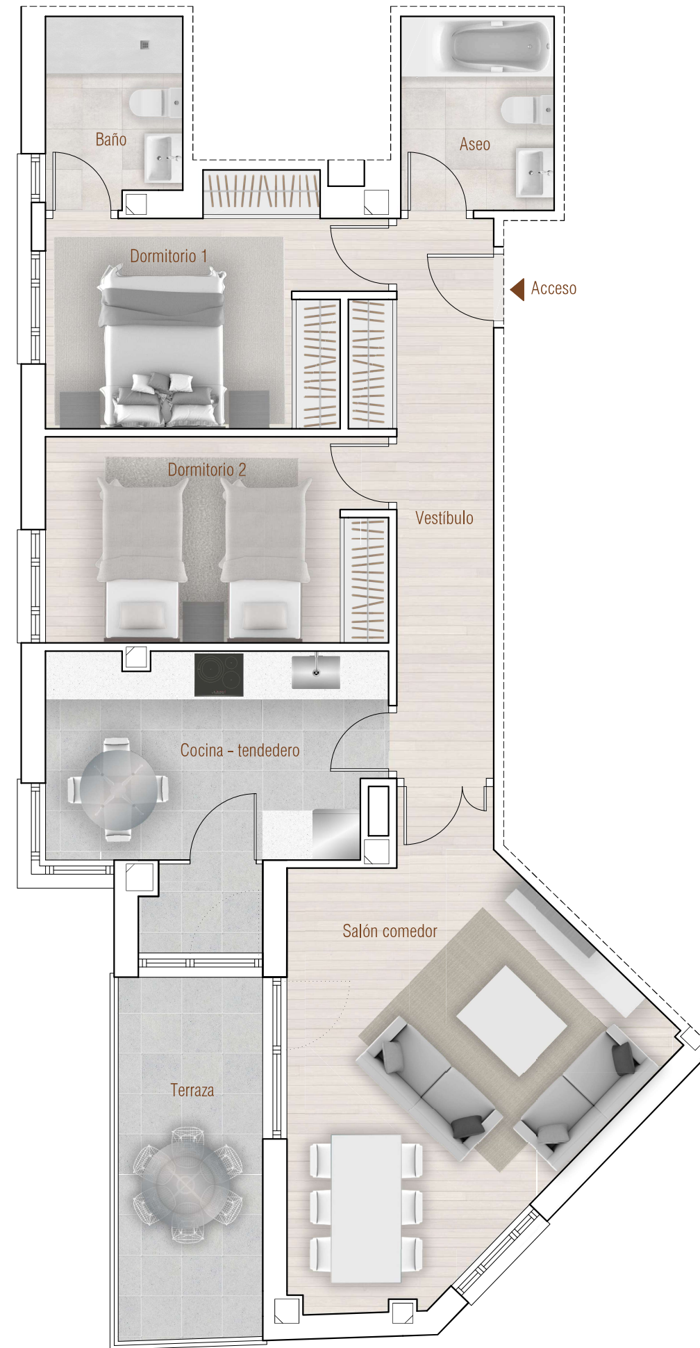
Calle Lazarillo de Tormes

Nota importante: La información gráfica contenida en este soporte es orientativa, y podrá experimentar variaciones por causas de índole técnica, jurídica y comercial. Asimismo, el mobiliario, la decoración, los elementos de ambientación y los electrodomésticos incluidos son de carácter decorativo y no son objeto de contratación. Las superficies expresadas son aproximadas.